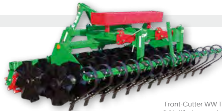
Front-Cutter WW T mit Blattfedervorsatz