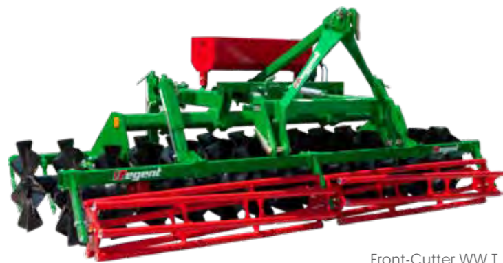
Front-Cutter WW T mit Rohrstabwalze und Messervorsatz