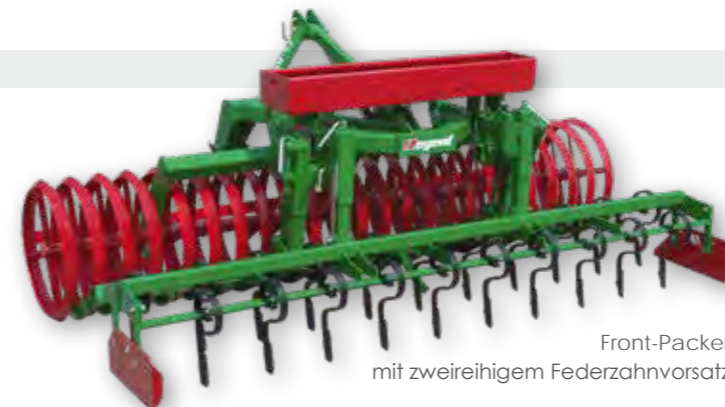
Front-Packer mit zweireihigem Federzahnvorsatz